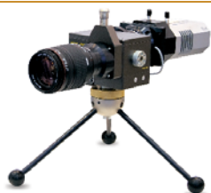
ANDOR社製 超高感度CCD検出器接続例