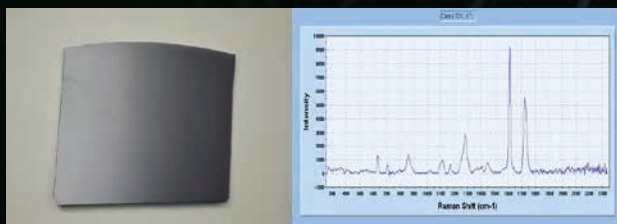
黒色プラスチックの判別 (例: ポリエチレンテレフタレート)

45種類以上の汎用プラスチックデータベース登録済 (PET、PP、PS、PVC、ABS、アクリル、ナイロン等) ユーザー独自の測定データも追加登録可